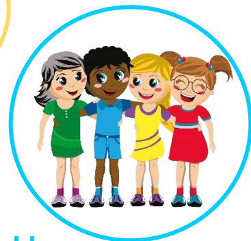
In de klas

Kinderen en volwassenen 'groeien' als er vooral wordt gelet op wat zij goed doen. De verhouding 4:1 houdt in dat we vier keer vaker een compliment uitdelen dan een correctie. Hiermee creëren we voor anderen het perfecte klimaat om in te groeien. Probeer vanavond of morgenochtend deze verhouding te halen bij mensen in je omgeving. Let daarbij specifiek op het effect van je compliment.