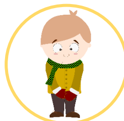
De stille leerling