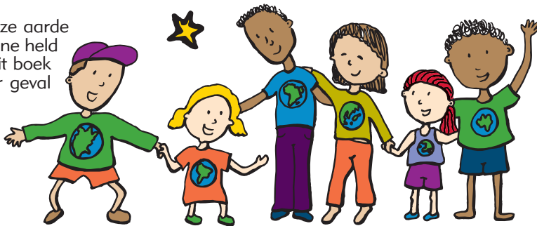
Jacqueline Cramer Minister van Ruimte en Milieu